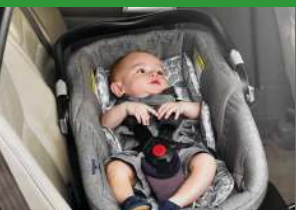
Автокресло «люлька» группы 0 (для детей массой < 10 кг)*

При покупке детского удерживающего устройства обязательно следует уточнить у продавца наличие сертификата на товар!