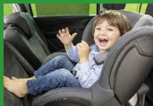
Автокресла групп I (для детей массой 9-18 кг)*