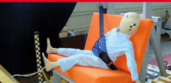
Результаты тестов использования небезопасных удерживающих устройств*

Дополнение определения «направляющая ляжка» в Правилах ЕЭК ООН № 44-04 было одобрено Всемирным Форумом (WP.29). Внесенная поправка к формулировке указывает на то, что «направляющая ляжка» рассматривается как составной элемент детской удерживающей системы и НЕ может отдельно официально утверждаться в качестве детской удерживающей системы в соответствии с настоящими Правилами». Это исключает даже формальную возможность сертификации устройств типа «направляющая ляжка»!