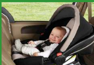
Автокресло группы 0+ (для детей массой < 13 кг)*