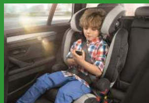
Автокресло группы II и III (для детей массой 15-36 кг)